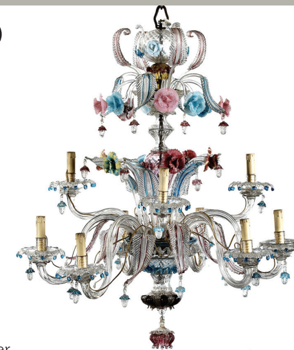
Chandelier Verre Italie (Murano) XIX ème siècle Présidence de la République