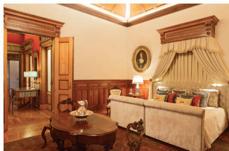
Chambre de la suite de D. Carlos

Le Palais de la Citadelle de Cascais relève de la Présidence de la République. Entre 2007 et 2011, le palais a subi des travaux de réfection, permettant ainsi de réaliser des initiatives de la Présidence, ainsi que de loger les chefs d'État – et délégations respectives – en visite au Portugal. Depuis 2011, il est ouvert au public – pour la première fois au cours de sa longue histoire – et offre un programme culturel diversifié, comme des visites guidées au palais et à la chapelle, des expositions temporaires et d'autres initiatives.