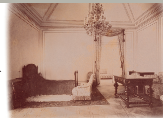
Chambre du roi D. Luís au Palais de la Citadelle de Cascais.