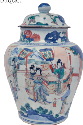
Jarre Porcelaine décorée en bleu sous couverte et émaux sur couverte, wucal ou «cinq couleurs» Chine Milieu du XVII ème siècle Maison Reynaldo dos Santos / Mairie de Cascais