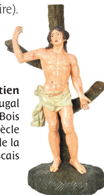
Saint Sébastien Portugal Bois XVIII ème siècle Palais de la Citadelle de Cascais