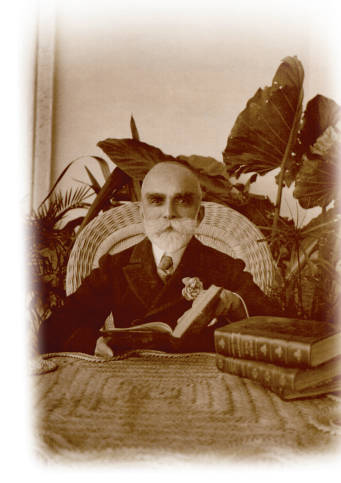
Bernardino Machado au Palais de la Citadelle de Cascais. 1917