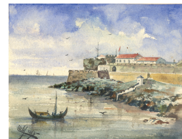
Palais de la Citadelle de Cascais D. Carlos Aquarelle, 1885 Musée-bibliothèque de la Maison de Bragança