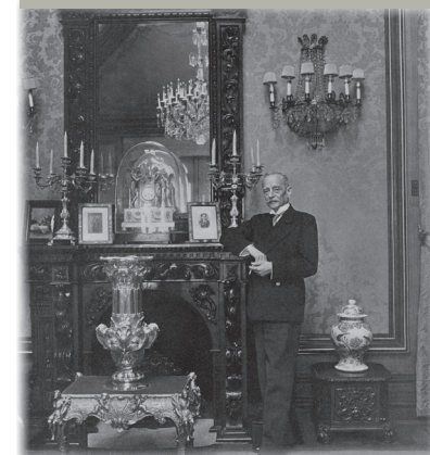
Oscar Carmona dans le salon du Palais de la Citadelle de Cascais.

Oscar Carmona a choisi de vivre dans le Palais de la Citadelle avec sa famille, entre 1928 et 1945.