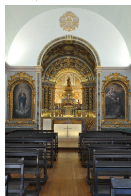
Maitre-autel de la Chapelle de Nossa Senhora da Vitória

étaient tirés), les bâtiments et la chapelle de Nossa Senhora da Vitória (Notre Dame de la Victoire).